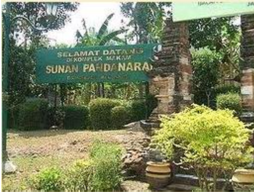
Makam Ki Ageng Pandanaran di Bukit Jabalkat, Desa Paseban, Kecamatan Bayat, Kabupaten Magelang, Jawa Tengah

Asal cerita : Kabupaten Klaten, Jawa Tengah